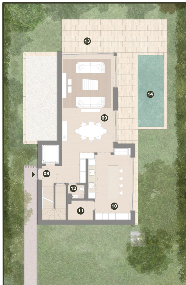
PISO 0 GROUND FLOOR