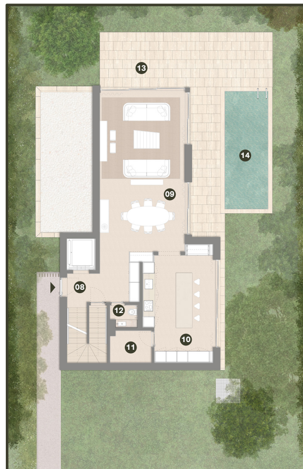
PISO 0 GROUND FLOOR