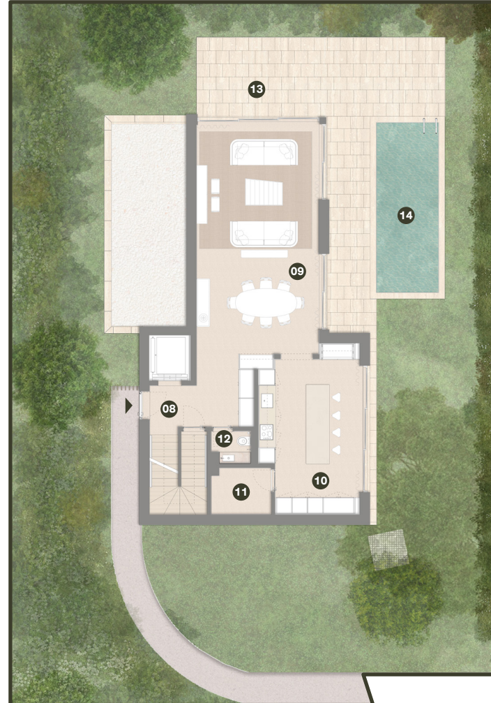
PISO 0 GROUND FLOOR