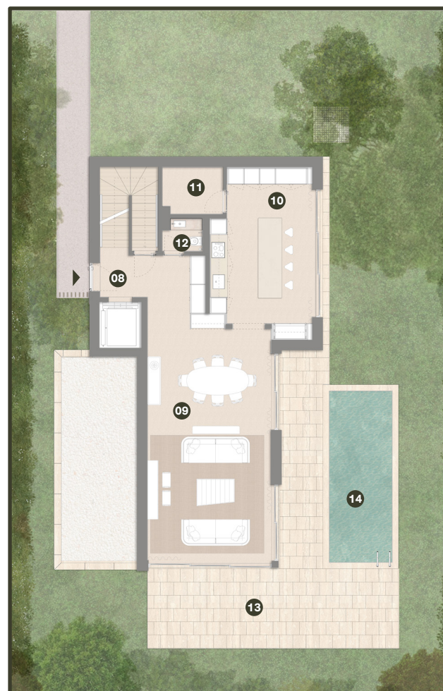
PISO 0 GROUND FLOOR