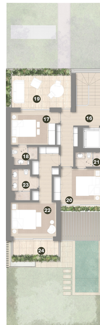
PISO 1 1 ST FLOOR