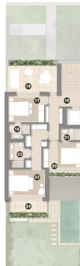
PISO 1 1 ST FLOOR