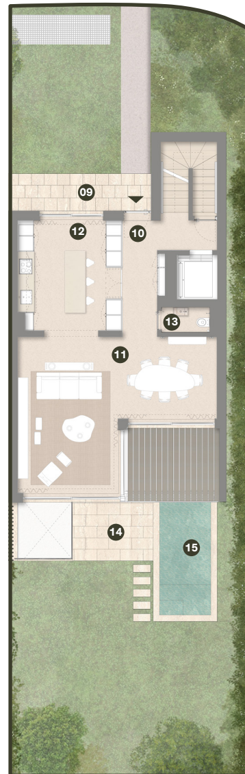
PISO 0 GROUND FLOOR