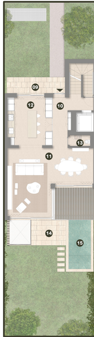
PISO 0 GROUND FLOOR