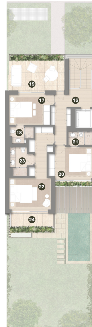
PISO 1 1 ST FLOOR